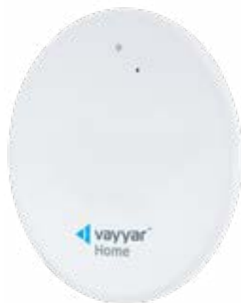
プラスチックケース（前面）