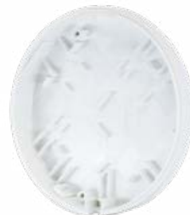
プラスチックケース（後面）