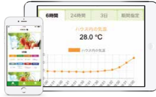
ハウス内のデータをスマホ・タブレットで閲覧