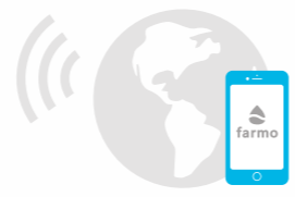
スマートフォンでいつでもどこでも確認